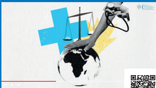
Présentation de l'institut