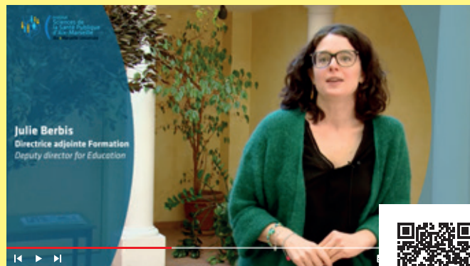
L'institut vu par ses membres